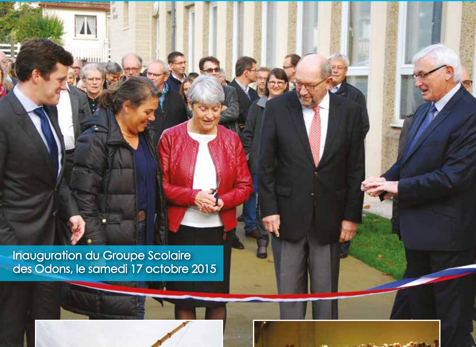
Inauguration du Groupe Scolaire des Odon, le samedi 17 octobre 2015