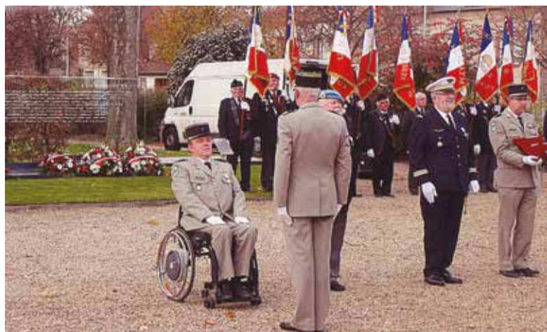
5 décembre - Jardin Claude DECAEN - Cérémonie d'hommage aux Morts pour la France pendant la Guerre d'Algérie et les combats du Maroc et de la Tunisie

Plus que jamais, le «Devoir de Mémoire» interpelle chacun d'entre nous, Anciens Combattants ou non. Assurons-en la pérennité en restant unis à travers les générations.