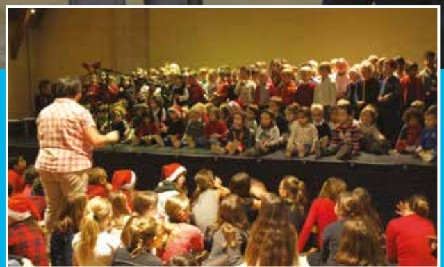
Spectacle de Noël des écoles, le vendredi 11 décembre au Domaine de la Baronnie