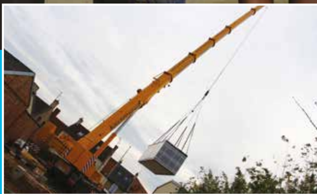
Quatre nouveaux logements au 52, route de Bretagne